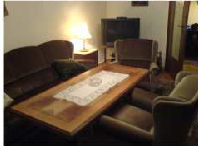
Fotos der Gästewohnung